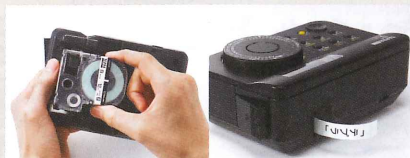
カートリッジのセットも簡単! 印刷されたラベルをカット!